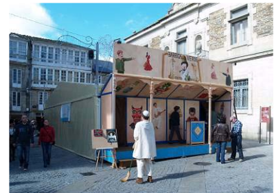
San Froilán de Lugo