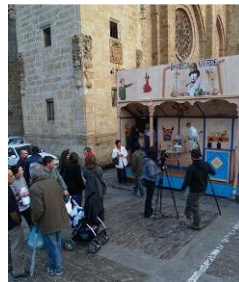
San Lucas de Mondoñedo