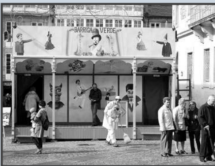
Fachada da nova Barraca